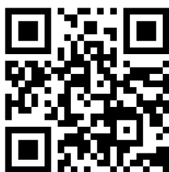
QR Code เข้าระบบสมัครออนไลน์

๘.๑ กรอกข้อมูลการสมัครผ่านทางระบบรับสมัครนักเรียน นักศึกษา ออนไลน์ทางอินเทอร์เน็ตของสำนักงานคณะกรรมการการอาชีวศึกษา ( https://admission.vec.go.th ) หรือ QR Code ที่ระบุไว้ด้านล่าง เพื่อเข้าศึกษาต่อวิทยาลัยเทคนิคนครศรีธรรมราช ให้ครบถ้วน และปรีนใบสมัครจากระบบออนไลน์ ตัดรูปถ่ายขนาด ๑ นิ้ว พร้อมลงชื่อผู้สมัครให้เรียบร้อย (ตัวอย่างขั้นตอนการกรอกข้อมูลอยู่ท้ายประกาศ) นักเรียนสมัครเรียนได้เพียง ๑ สาขาวิชาเท่านั้น