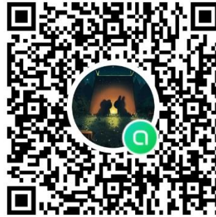
เข้ากลุ่มไลน์ไควตา