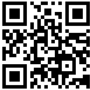
เข้าระบบสมัครออนไลน์